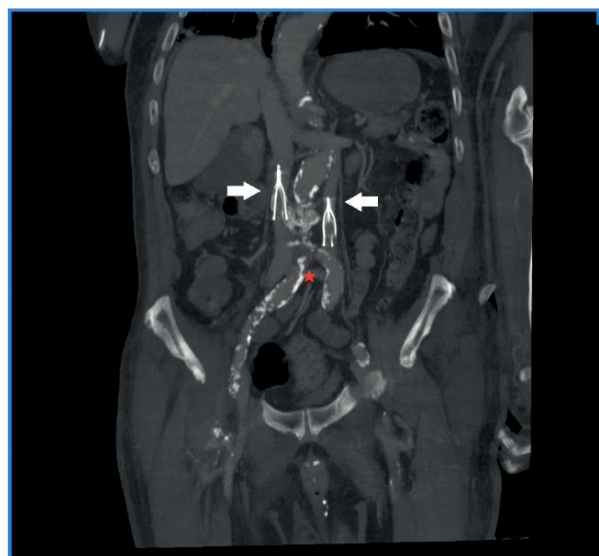
Figura 2. Angio-TAC que muestra la anatomía de la VCI duplicada: la vena iliaca externa derecha, que se extiende hacia el sistema cavo derecho (flecha derecha), la vena iliaca externa izquierda, que se extiende hacia el sistema cavo izquierdo (flecha izquierda), y la vena comunicante interiliaca (estrella).

con deterioro del punto de vista respiratorio e inflamatorio y, posteriormente, con fallo orgánico múltiple atribuido a la infección por SARS-CoV-2, hasta fallecer en la unidad.