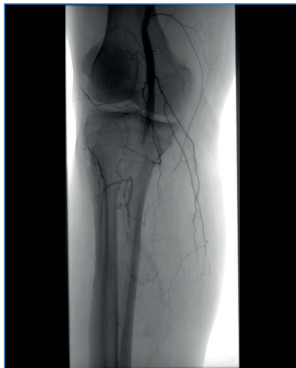
Figura 1. Imagen arteriográfica. Trombosis poplíteo.

Se inició la perfusión de activador del plasminógeno (rTPA) a dosis de 0,3 mg/kg cada hora durante tres horas, con un total de 30 mg, y se repitió el ciclo hasta conseguir la desaparición de los signos de isquemia y recuperar el pulso pedio (fig. 2). Los niveles de fibrinógeno fueron monitorizados entre ambos ciclos. Durante las doce horas posteriores a la fibrinólisis, se mantuvo una perfusión intracatéter poplíteo de heparina sódica a dosis terapéutica con el objetivo de evitar la retrombosis en estos casos de hipercoagulabilidad. Una vez el catéter fue retirado, el paciente continuó anticoagulado con enoxaparina durante su recuperación en planta y durante tres meses después del alta.