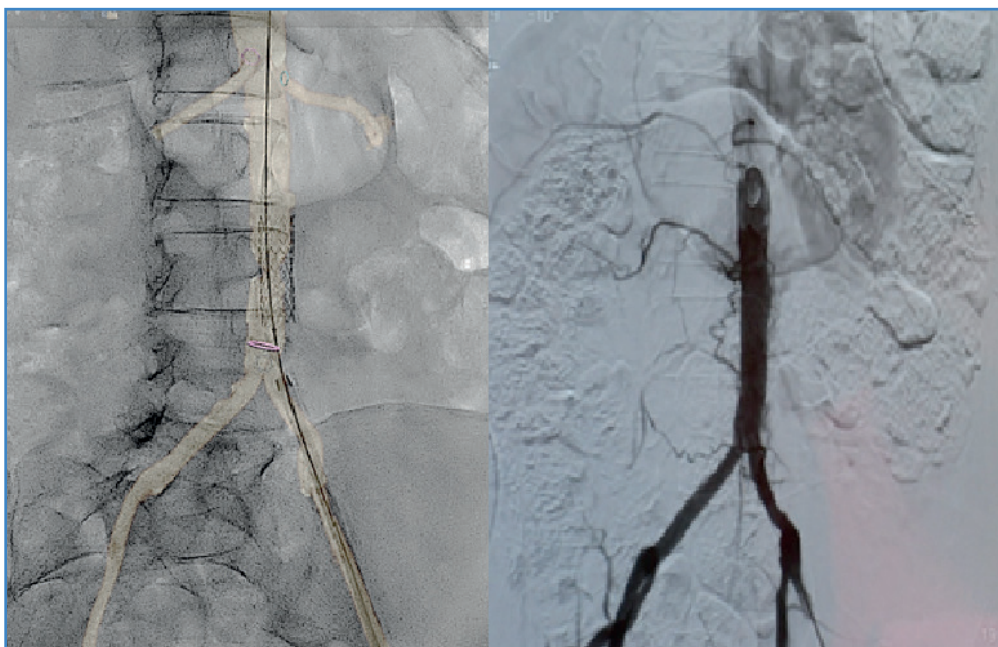
Figura 2. Roadmapping de la coartación con liberación del stent aórtico y angiografía final.