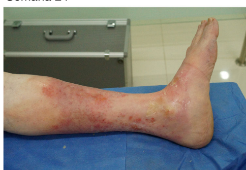
Figura 2 Seguimiento clínico.

tasas de cierre de 2,2 \text{ cm}^2/\text{semana} , que puede estar relacionada con la persistencia de la hipertensión venosa local o axial. La ventaja de esta técnica es que es fácilmente repetible y con mínima morbilidad. Se les realizó nuevamente a los pacientes que presentaron recanalización parcial ecoesclerosis de los segmentos recanalizados, con oclusión del 100% a las 12 semanas, oclusiones similares a otras series luego de 2 procedimientos de ecoesclerosis en un intervalo breve de tiempo 16 .