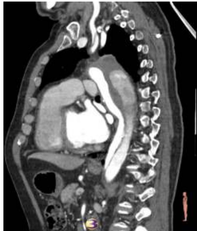
Figura 1 Angio-TC. Disección aórtica aguda tipo B que afecta a aorta torácica descendente y carótida común izquierda. Dilatación de aorta torácica.

El objetivo de este artículo es comentar la evidencia disponible en la actualidad sobre el tratamiento de la disección aórtica tipo B aguda complicada y no complicada. Especialmente, vamos a centrarnos en las últimas publicaciones sobre la elección del tratamiento médico o tratamiento