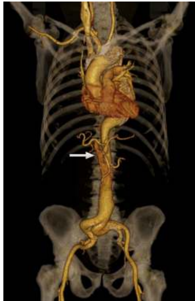
Figura 2 Angio-TC reconstrucción 3D. Disección aórtica tipo B tratada mediante TEVAR con trombosis de la luz falsa en porción torácica y permeabilidad de falsa luz en segmento infradiafragmático (flecha).

La trombosis de la luz falsa y la remodelación aórtica es el objetivo ideal del tratamiento de la disección aórtica tipo B.