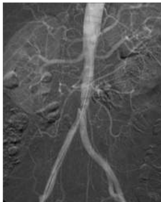
Figura 1 Placa ateromatosa previo a la bifurcación aórtica.

Se realizó un electrocardiograma que descartó una fibrilación auricular y se solicitó una TAC toracoabdominal, donde se objetivó la presencia de una placa ateromatosa localizada unos 2 cm proximal a la bifurcación aórtica y se descartó la presencia de un aneurisma como posible fuente de embolia. Se realizó también una arteriografía (fig. 1) que