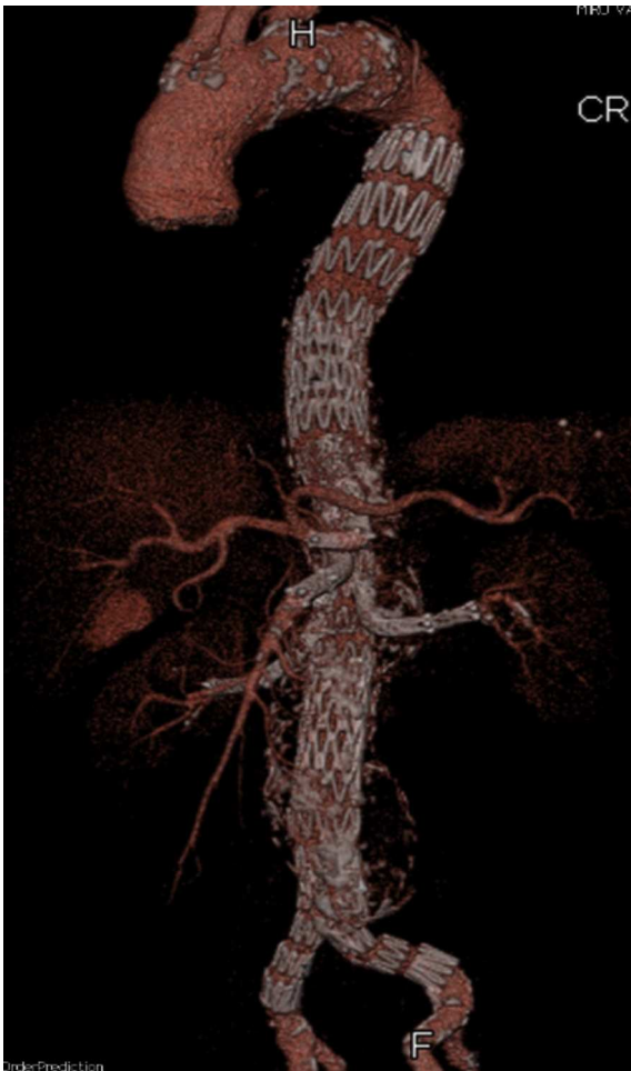
Figura 2 Control a los 5 años de un AATA tipo III tratado en nuestro centro con una endoprótesis ramificada.

para la fabricación de las endoprótesis a medida, pero que se está resolviendo en parte con la disponibilidad de alguna endoprótesis toracoabdominal estándar, lo que también contribuye a reducir el coste final del procedimiento. Finalmente, la técnica de implante es altamente exigente desde el punto de vista de la pericia endovascular, la necesidad de materiales accesorios y la exposición a tiempos prolongados de irradiación. De nuevo, el volumen permite minimizar estos inconvenientes a base de acumular experiencia y practicar la técnica de forma continuada.