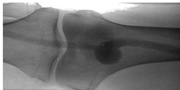
Figura 1 Flebografía ascendente.

Se resolvió mediante tratamiento quirúrgico, exploración vascular con vía de abordaje lateral. Fue objetivado aneurisma venoso poplíteo de 3 cm de diámetro aproximadamente, el cual recibía la afluencia de vena safena menor (fig. 2a). Se realizó aneurismectomía y reconstrucción mediante rafia lateral venosa, preservando la vena safena menor (fig. 2b). La paciente cursó un postoperatorio sin