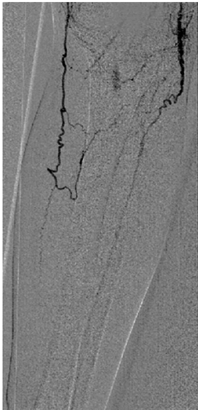
Figura 4 Imagen arteriográfica que muestra arteriopatía distal severa, con salida por ramas colaterales procedentes de tercera porción poplíteo.

Este cuadro va a requerir una intervención urgente que detenga la hemorragia y disminuya las complicaciones. La