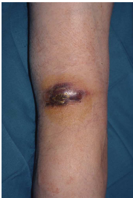
Figura 1 Hematoma en hueso poplíteo drenando al exterior mediante una fístula cutánea.

presentación clínica, método diagnóstico, microbiología, anatomía patológica, técnica quirúrgica y resultados.