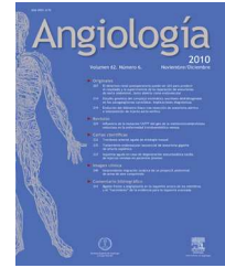
IMAGEN CLÍNICA DEL MES. SOLUCIÓN