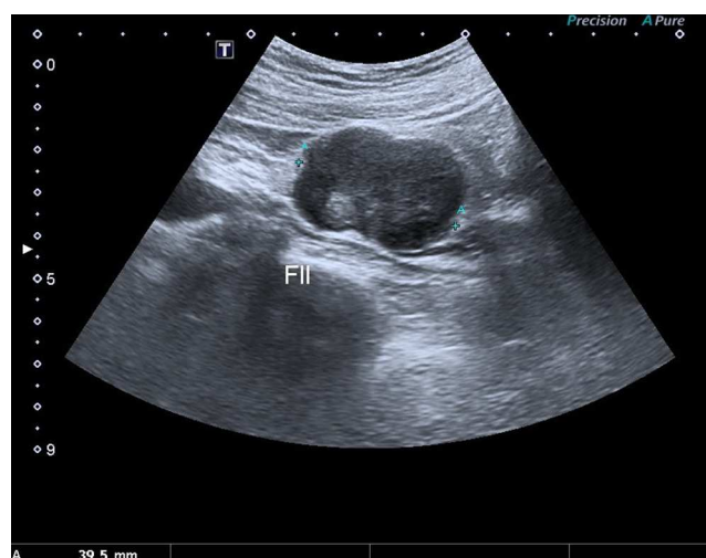
Figura 1 Ecografía abdominal que muestra lesión en la fosa iliaca izquierda.

Estudio de extensión con PET/TAC: masa en hemipelvis izquierda adyacente a la bifurcación de la arteria iliaca