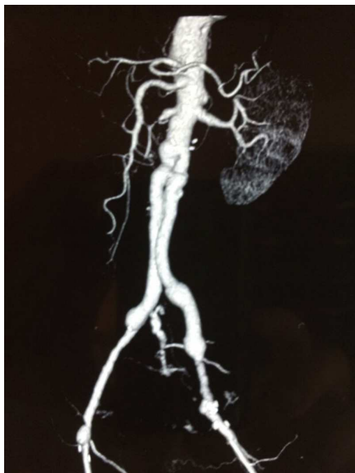
Figura 4 Angio-TAC de control tras reconstrucción aórtica con venas autólogas.

fístula del 9-22% 6,23,36 . La epiploplastia se ha descrito como método para disminuir esta incidencia 37 . Cuando el defecto intestinal es menor de 3 cm, puede realizarse una sutura directa de la pared intestinal. Si el defecto es mayor, debe realizarse resección duodenal 4 . O'Connor et al., en 2006, publican un metaanálisis en el que comparan la mortalidad