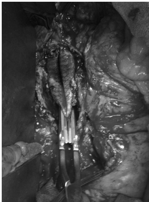
Figura 3 Imagen quirúrgica de rotura de línea de sutura de anastomosis proximal de prótesis aórtica con relación a FAE.