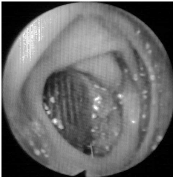
Figura 1 Imagen endoscópica de prótesis aórtica a través de erosión de la pared duodenal (FAE secundaria).

digestiva en un paciente portador de una prótesis aórtica debería suscitar un alto índice de sospecha de existencia de FAE, incluso en ausencia de signos o síntomas de infección crónica. De hecho, la existencia de hemorragia digestiva tras cirugía reconstructiva aórtica debería considerarse que es causada por la existencia de una FAE hasta que se demuestre lo contrario.