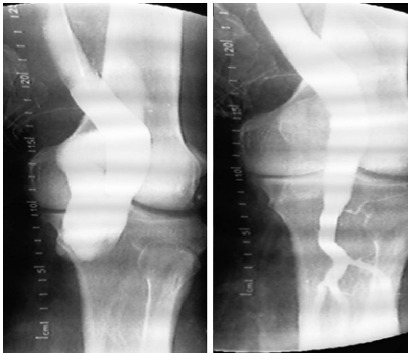
Figura 2 FAV poplítea. Resultado tras la reparación endovascular.

aneurisma ilíaco mediante un bypass iliofemoral, con buena evolución posterior.