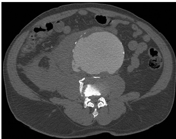
Figura 1 TC abdominopélvica, corte axial: aneurisma de aorta abdominal infrarrenal roto con fístula aortocava.

Disponible en Internet el 20 de enero de 2012