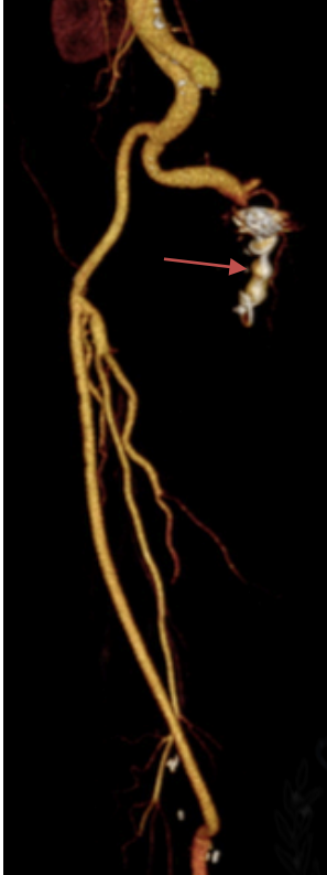
Fig. 2. Reconstrucción 3D posoperatoria donde se observa la trombosis completa de la arteria ciática persistente y la revascularización de la extremidad a través de un bypass femoropoplíteo.