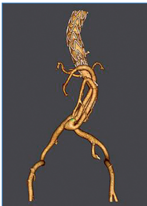
Figura 2. Angio-TAC torácico-abdominal posquirúrgico, reconstrucción 3D.

En el seguimiento a los 24 meses, la paciente se encuentra asintomática y con buen estado general.