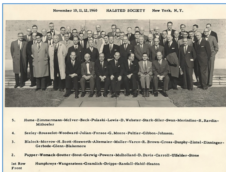
Figura 2. Halsted Society, 1960. En el pie de la foto, el nombre de ilustres cirujanos.