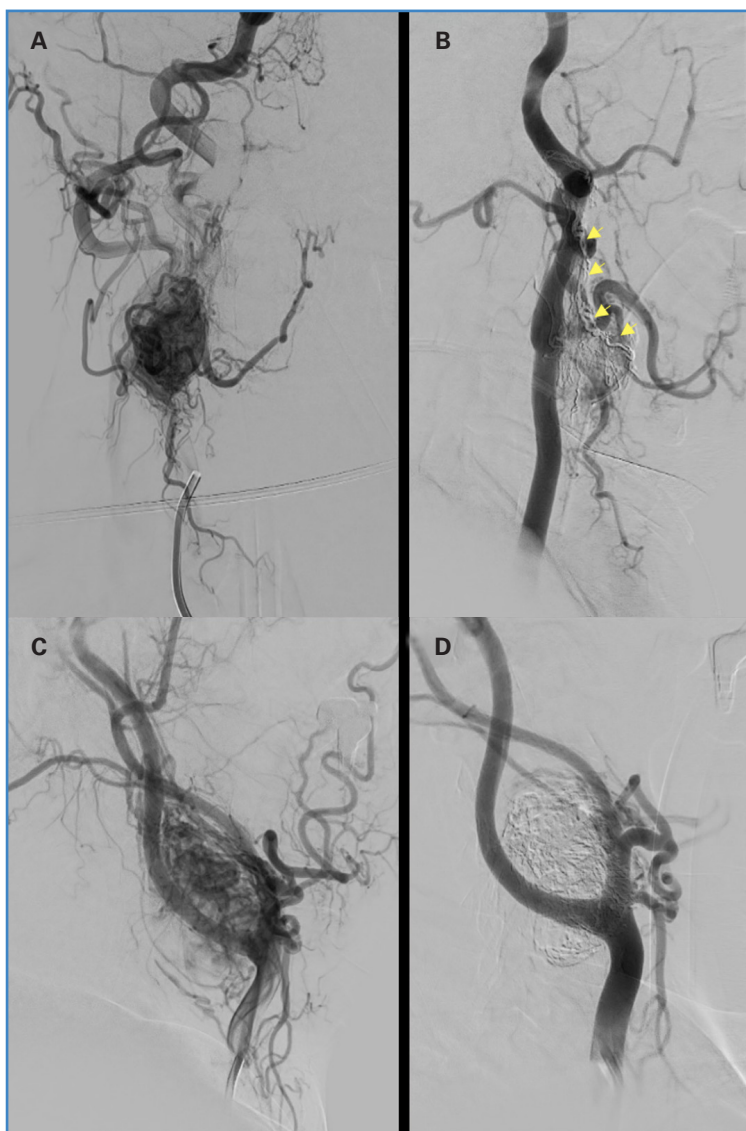
Figura 2. Arteriografía pre- y posembolización de PGC. A. Arteriografía de PGC Shamblin II. B. Embolización de PGC Shamblin 2 con Onyx® y protección de rama neuromeningea con coils (flechas amarillas). C. Arteriografía de PGC Shamblin III. D. Control tras embolización con Onyx®.

de los pacientes por clasificación de Shamblin o por tamaño del tumor; los tumores de mayor tamaño o Shamblin III son los más susceptibles de embolización. Esto podría justificar una mayor estancia hospitalaria o un mayor sangrado; no obstante, es una especulación, ya que los datos no están disponibles para su análisis. Concluyen, por tanto, que una EP no aporta beneficios sobre la pérdida de sangre durante la cirugía, tasa de ictus, lesión nerviosa y estancia hospitalaria.