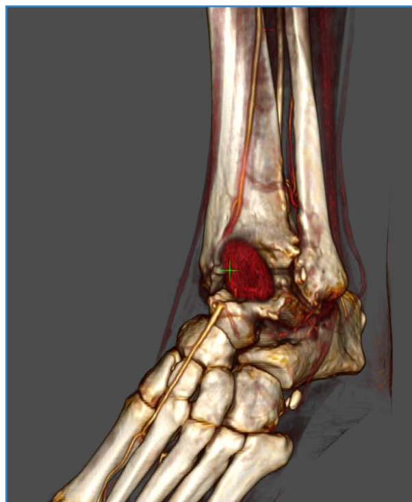
Figura 1. Reconstrucción anterolateral.

Se realizó angio TC de urgencia que evidenció colección espontáneamente hiperdensa centrada en receso tibial anterior con extensión a articulación tibioastragalina y astragalocalcánea ipsilaterales, con tamaño de 31 × 65 × 49 mm (AP-T-CC) (Fig. 1)