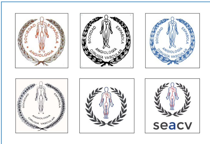
Figura 4. Evolución del emblema de la Sociedad Española de Angiología y Cirugía Vascular (de izquierda a derecha y de arriba a abajo).

Otro aspecto que deseamos comentar es la evolución histórica del emblema de la sociedad (Figs. 4 y 5).