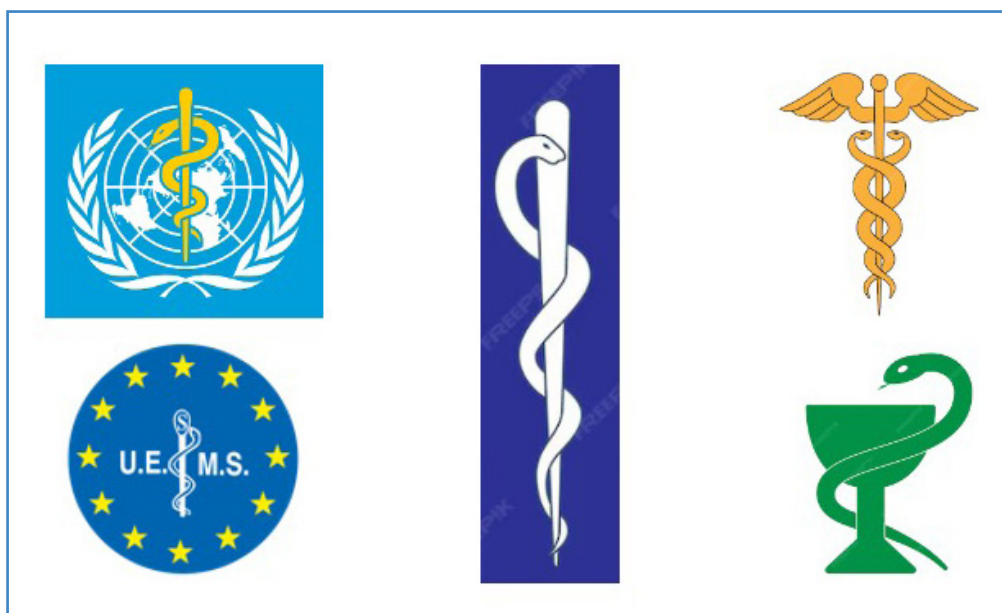
Figura 1. En el centro de la figura podemos apreciar el báculo de Asclepio o Esculapio (una serpiente alrededor de una larga y fina vara de ciprés con un nudo en el extremo superior), y a su izquierda, dos conocidos ejemplos (OMS y UEMS). Arriba a la derecha, se aprecia el caduceo de Hermes o Mercurio (dos serpientes y el bastón alado [para los romanos simbolizaba el comercio]), y abajo, la copa de Higiea, hija de Asclepio (una serpiente enroscada en una copa o cáliz, representativa de los farmacéuticos).

El primer símbolo está fuertemente relacionado con la serpiente (y su simbolismo de rejuvenecimiento, por la muda de su piel). En este sentido, el báculo de Asclepio o Esculapio (dios griego o romano de la medicina) es el símbolo médico más antiguo conocido. El caduceo de Hermes (Mercurio para los romanos), también de origen antiguo, se vinculó con la medicina, según algunos de forma errónea, solo a partir del siglo XIX. Finalmente, la copa de Higiea o Hygeia (hija de Asclepio) está relacionada con los farmacéuticos (Fig. 1). Báculo, caduceo y copa poseen una historia llena de bellas leyendas mezcla de componentes mitológicos y reales.