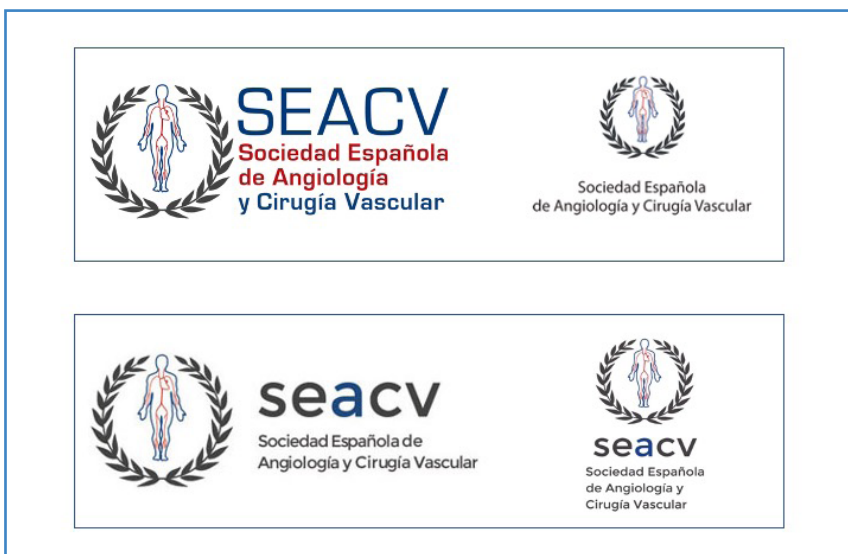
Figura 5. Emblema actual de la Sociedad Española de Angiología y Cirugía Vascular; versiones del logo-símbolo de interés corporativo (tipografía, papelería comercial, rotulación, etc.).