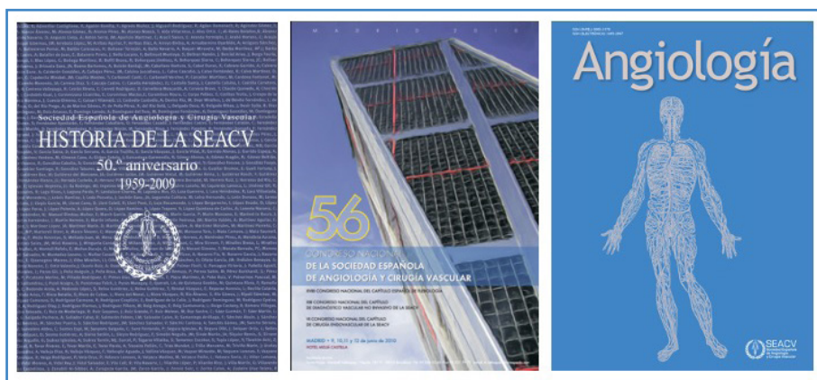
Figura 2. Color corporativo de la Sociedad Española de Angiología y Cirugía Vascul: azul claro y oscuro. Ejemplos representativos: portadas y carteles.

Efectivamente, los diferentes tonos azules suelen aplicarse en el diseño corporativo de muchas instituciones, empresas y medios de comunicación para transmitir seguridad y credibilidad. Por ello, aunque quizás sin saberlo, fue el color corporativo elegido por nuestra sociedad científica.