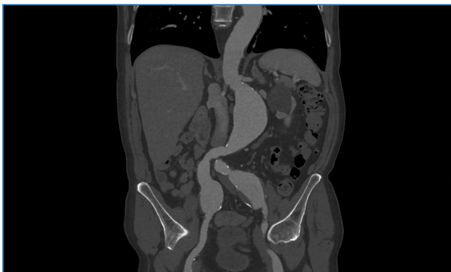
Figura 1. Angio TC con anatomía del caso: AAA yuxtarenal y de ambas arterias ilíacas comunes.

Dados estos hallazgos, se decide la realización de tratamiento endovascular complejo tras llevar a cabo la planificación quirúrgica correspondiente: embolización de arteria hipogástrica izquierda + branch ilíaco derecho + Ch-EVAR.