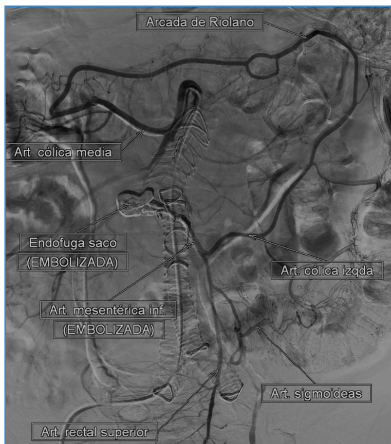
Figura 2. Arteriografía final que muestra la correcta exclusión de la T2EL.

Desde hace años existe una tendencia creciente a utilizar agentes líquidos. En concreto, los que se basan en EVOH (Onyx o Squid Peri) son los más novedosos. Inicialmente este agente nació para embolizar malformaciones arteriovenosas, pero poco a poco su uso fue extendiéndose a otros campos. La ventaja del EVOH es que permite una solidificación más lenta, lo que permite una liberación más precisa, rellenando el saco completamente, incluidos los vasos de entrada y de salida. La literatura actual no recoge ningún gran ensayo prospectivo aleatorizado que incluya EVOH para el tratamiento de las T2EL. La mayoría de estudios publicados son series de casos, como en el que Salaskar AL y cols. (2) evalúan la seguridad y la eficacia del EVOH en la embolización de diferentes