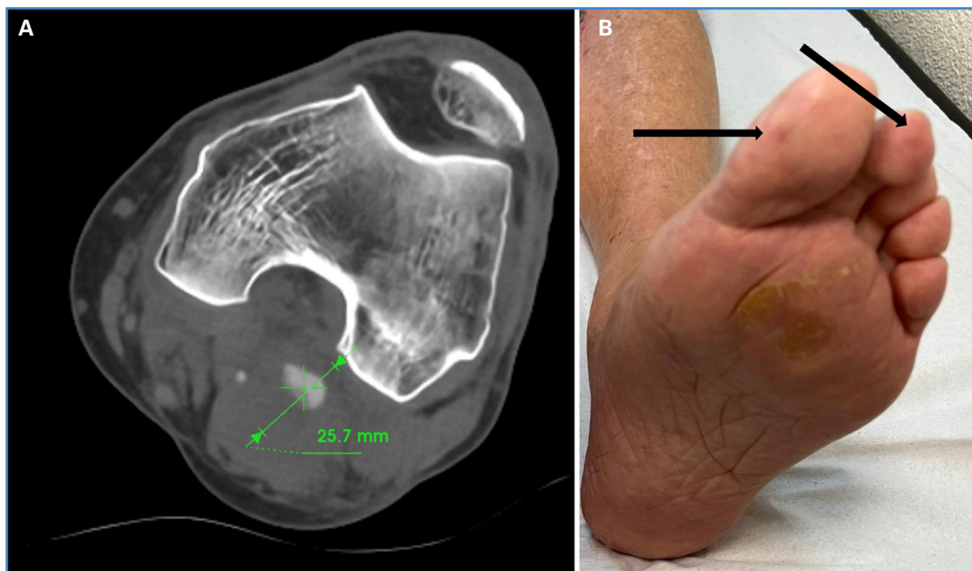
Figura 1. A. Aneurisma poplíteo izquierdo, diámetro al diagnóstico. B. Flechas negras: lesiones cianóticas puntiformes digitales sugerentes de embolización distal.