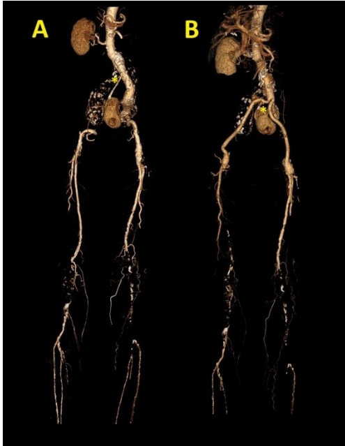
Figura 1. A. Reconstrucción tomográfica arterial antes de la cirugía. El asterisco indica la arteria renal de origen ectópico. B. Reconstrucción tomográfica arterial después de la cirugía. El asterisco indica la arteria renal.