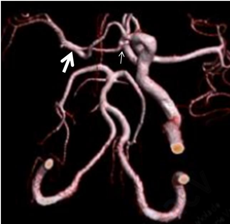
Figura 2. Reconstrucción VR de angio RM de vasos cerebrales con técnica 3D TOF en la que se visualiza la agenesia de la arteria carótida interna derecha, con la anastomosis compensatoria del segmento cavernoso de la ACI izquierda (flecha blanca delgada) y con el segmento M1 de la ACM derecha (flecha blanca gruesa). VR: volumen rendering ; RM: resonancia magnética; TOF: time of flight ; ACI: arteria carótida interna. ACM: arteria cerebral media.