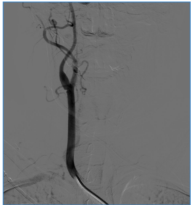
Figura 1. Imagen de arteriografía tras el procedimiento de trombectomía urgente en la que se observa septo en carótida interna derecha sugestivo de carotid web.

Mujer de 37 años sin antecedentes médico-quirúrgicos reseñables. Acude a urgencias por hemiplejía izquierda de 3 horas de evolución. Se diagnostica mediante tomografía computarizada (TC) cerebral de infarto de arteria cerebral media derecha, por lo que se realiza trombectomía mecánica urgente. Durante el procedimiento, se observa en la arteriografía septo no oclusivo en el segmento bulbar de la arteria carótida derecha, sugestivo de carotid web (Fig. 1). Descartado el origen cardíaco y como presentaba ritmo sinusal y ecocardiograma sin alteraciones, se solicita angiografía por TC, que confirmó dicho diagnóstico. Se decide endarterectomía de carótida interna derecha (Fig. 2) y cierre con parche de vena safena interna autóloga. Fue dada de alta después de 72 horas sin complicaciones. Posteriormente se observa permeabilidad a los 6 meses y ausencia de reestenosis.