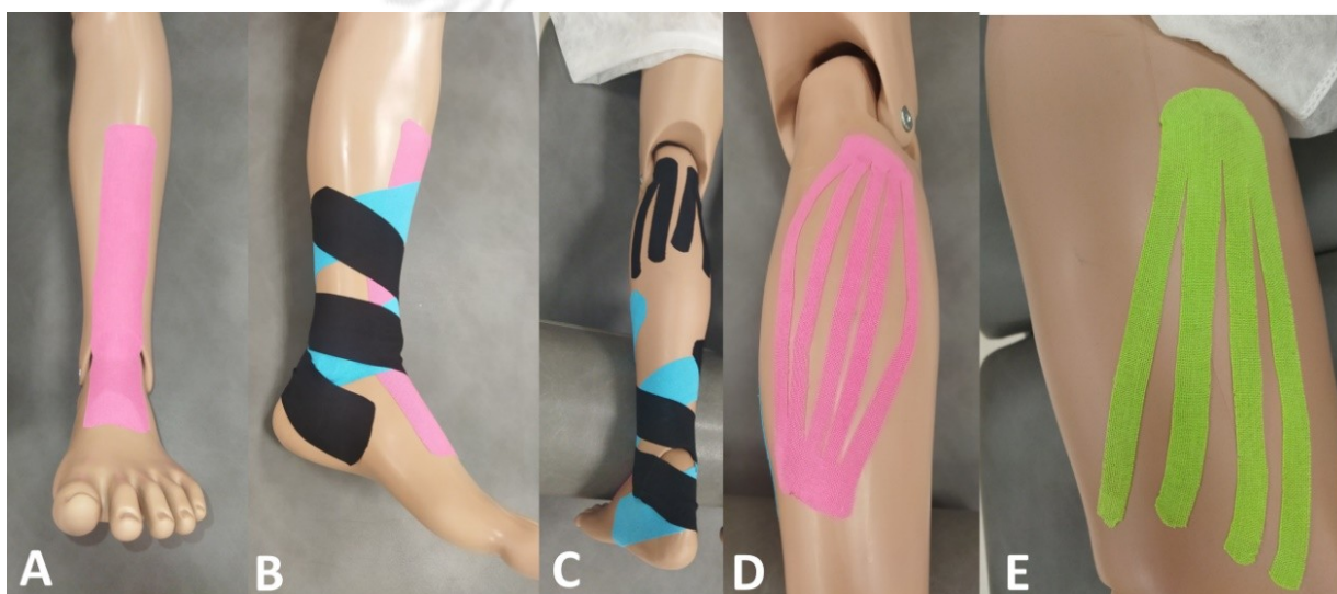
Figura 3. Aplicaciones del KT relacionadas con los estudios incluidos. A. Aplicación para corrección funcional del tobillo (corte en I sobre tibial anterior). B. Tiras para compresión venosa desde región maleolar

En la figura 4 se representa la evaluación del riesgo de sesgo gráficamente de manera individualizada para cada estudio (22).