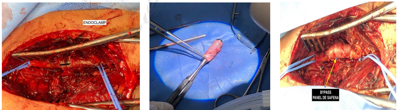
Figura 2. Secuencia de exploración vascular de la arteria axilosubclavia con previo control endovascular y posterior reconstrucción con panel de safena mayor.