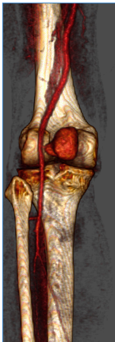
Figura 1. Angiografía por tomografía computarizada donde se aprecia voluminoso pseudoaneurisma poplíteo con un cuello pequeño y estrecho localizado en la 2.ª porción de la arteria poplítea.

Debido a su obesidad, el extenso hematoma a nivel de la fosa poplítea, la localización del pseudoaneurisma y, además, la presencia de un cuello corto y estrecho, se decide realizar una punción ecoguiada de trombina.