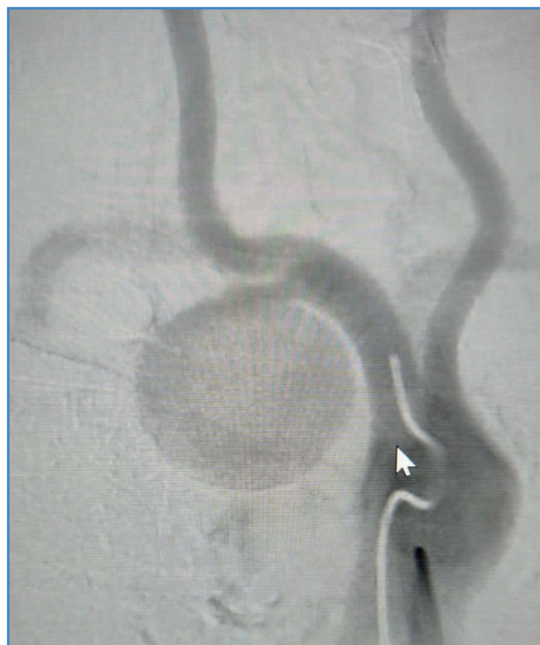
Figura 1. Aneurisma subclavio derecho en arco aórtico bovino con cuello proximal hostil por presentar longitud y diámetro de 5 × 5 mm.

Se presenta el caso de un paciente varón de 47 años que consulta en el servicio de guardia por dolor torácico inespecífico y tos de 1 semana de evolución. El médico clínico de guardia le solicita una radiografía de tórax simple en la que se observa aumento de la trama pulmonar en el ápice derecho, por lo que decide solicitar una tomografía sin contraste de tórax, en la que se constata tumoración de 40 × 30 mm en la proximidad a la bifurcación de la arteria carótida primitiva, por lo que se deriva al servicio de cirugía vascular con orden de angiotomografía. Se realiza y se observa aneurisma subclavio de gran tamaño (más de 46 mm). En arteriografía digital, realizada posteriormente, se observa un escaso cuello proximal de 5 mm de longitud, con un diámetro proximal de 5 mm, asociado a una variante anatómica de arco aórtico bovino (Fig. 1). Esta asociación determinó una hostilidad inusual para realizar las maniobras técnicas de navegabilidad en el cuello del aneurisma, ya que debía maniobrase dentro del tronco común a la subclavia y a ambas carótidas. Después de obtener imágenes