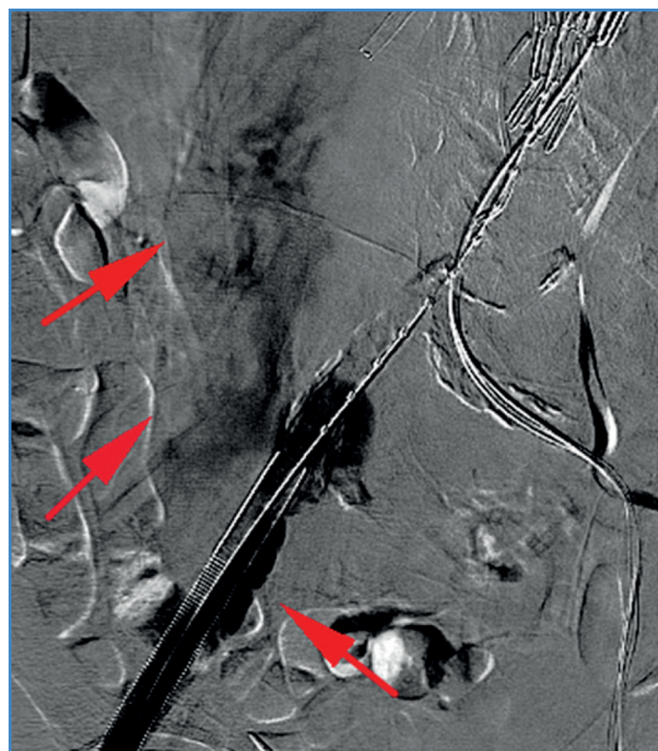
Figura 2. Ruptura de arteria ilíaca externa.

operatoria del 4,4 % (grupo A, 0 %, frente al grupo B, 9,1 %; p = 0,45 ). Una de las muertes fue la de una mujer debido a un shock hemorrágico secundario a una ruptura de la arteria ilíaca externa (Fig. 2) y la otra fue la de un hombre