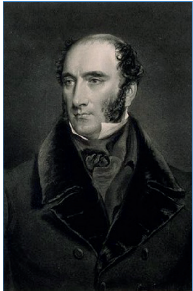
Figura 1. R. Liston (1839). Grabado de JC Bromley (Wellcome Colección Gallery, Londres).

Fue un polémico y exitoso cirujano escocés, que desarrolló su actividad quirúrgica, docente y escritora entre dos épocas, pos-Hunter y pre-Lister (1), y fue probablemente el mejor cirujano de su época (2). Fue un pionero que destacó por su habilidad en una era previa a la anestesia, cuando la velocidad era una virtud quirúrgica. Era muy fuerte y alto (1,88 m), de carácter