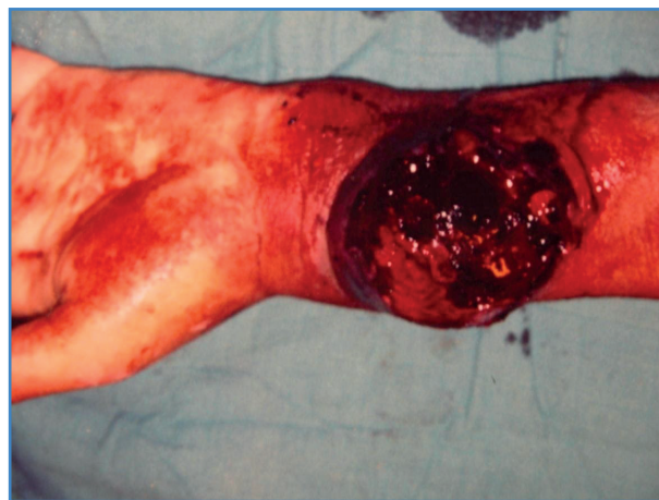
Figura 1. Vista preoperatoria que muestra a la exploración un pseudoaneurisma de la arteria radial roto.

En cuanto al tratamiento, comenzamos con 1 mg/kg de corticosteroides durante 1 mes, luego redujimos gradualmente la dosis y administramos 1 mg/día de colchicina. Los marcadores inflamatorios mostraron una cinética descendente con una normalización de la velocidad de la eritrosedimentación en 3 meses.