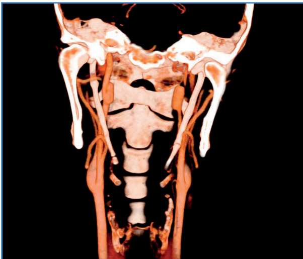
Figura 1. TC angiológico de troncos supraaórticos que muestra disección carotídea bilateral con pseudoaneurisma izquierdo y elongación de apófisis estiloides de 80 mm.

Durante la realización de ejercicios intensos de tonificación de abdomen y escalada comenzó con cefalea temporal y periocular izquierda asociada a alodinia al tacto del cuero cabelludo en la región frontal izquierda. Al día siguiente, al despertar, presentó ptosis palpebral izquierda. Acudió inmediatamente al servicio de Urgencias, donde fue valorado por el equipo de oftalmología y de neurología. En las pruebas complementarias se objetivó disección de ambas carótidas internas con apófisis estiloides de > 80 mm (Figs. 1 y 2).