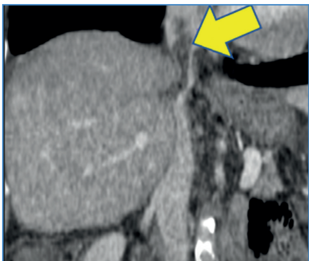
Figura 1. Corte sagital de angio TC que objetiva un defecto de repleción en la vena cava infra- y supradiafragmática.

Se entró en contacto con el servicio de angiología y cirugía vascular, y tras comentar el caso y dada la refractariedad al tratamiento sintomático, se decidió realizar una trombectomía mecánica percutánea reolítica de la vena cava supra- e infradiafragmática.