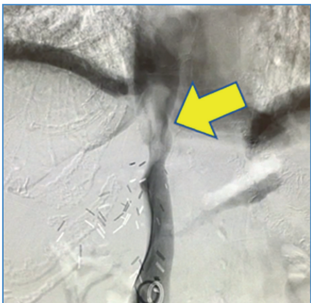
Figura 2. Flebografía diagnóstica que confirma la trombosis de la vena cava.

El abordaje se realizó mediante punción ecoguiada de la vena femoral común derecha. Tras la cateterización de la vena cava se intercambió por un introductor de 10 F y se realizó la trombectomía con el dispositivo AngioJet™ (concretamente, se utilizó el catéter Zelante, que está destinado para calibres mayores y es específico de territorios venosos). Posteriormente se realizó una flebografía en la que se objetivó la resolución completa de la trombosis. Se retiró el material y se realizó una hemostasia mediante compresión manual de la zona de punción. La cirugía transcurrió sin incidencias durante una hora. En la evolución posoperatoria de la paciente destacó una mejoría franca de la clínica con resolución del shock séptico y retirada de soporte vasopresor (Fig. 3).