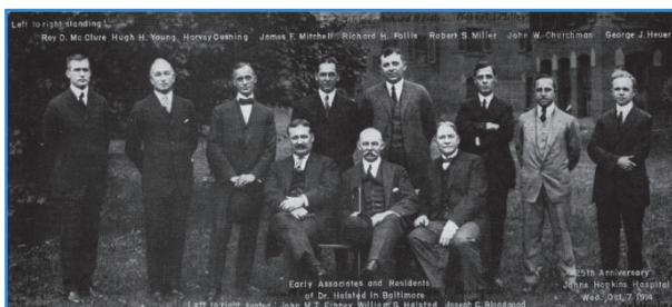
Figura 5. Asociación de residentes del profesor Halsted. Hospital Johns Hopkins, octubre de 1914.

Cornell, Virginia, Pittsburgh y Cincinnati), 6 fueron associate professor y solo cuatro se dedicaron a la práctica privada. Además, el Dr. Halsted tuvo 55 asistentes de residentes que estuvieron uno o más años con él, pero que no se convirtieron en jefes de residentes (3,11).