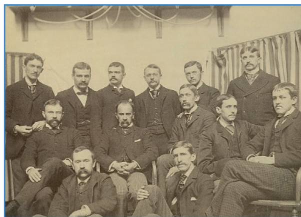
Figura 4. Primer grupo de internos del profesor Osler en el Hospital Johns Hopkins, abril de 1889.

El Dr. Halsted, durante sus 33 años en Hopkins, llegó a tener 17 jefes de residentes. De ellos, 7 se convirtieron en professor of surgery (Harvard, Yale, Stanford,