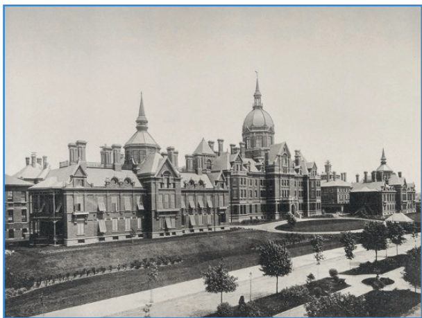
Figura 1. Johns Hopkins Hospital. Baltimore, Maryland, EE. UU. (1889).

Así las cosas, el primer programa moderno de residencia quirúrgica se desarrolló bajo la influencia de William Stewart Halsted (1852-1922) en Johns Hopkins (Fig. 3). A finales de 1889 implantó y desarrolló un novedoso programa de formación siguiendo