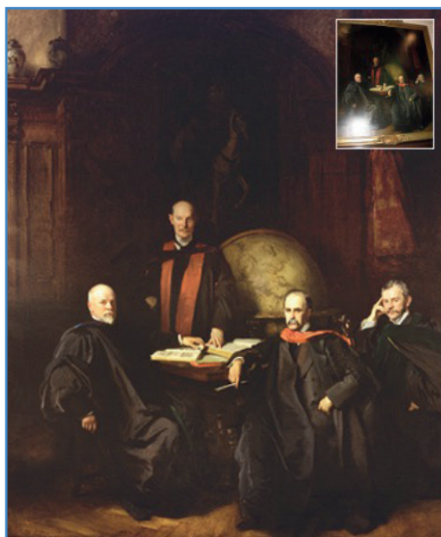
Figura 2. The Four Doctors (Los cuatro doctores). Óleo de John Singer Sargent (Londres, 1905). Retrato de los cuatro grandes médicos del Hospital Johns Hopkins: el patólogo William Henry Welch, el internista William Osler, el ginecólogo Howard Kelly (sentados, de izquierda a derecha) y el cirujano William Stewart Halsted (de pie). El cuadro cuelga hoy en la Biblioteca Welch, en Johns Hopkins.