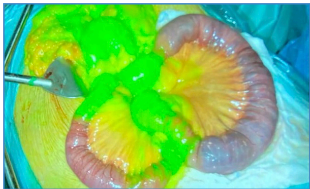
Figura 3. Visualización de la vascularización intestinal mediante fluorescencia con verde de indocianina.

Como principal variable de resultado se analizó la mortalidad intrahospitalaria asociada al procedimiento (mortalidad debida a la IMA o a sus complicaciones), analizando posteriormente los factores pronósticos de mortalidad (parámetros analíticos y tiempos de demora).