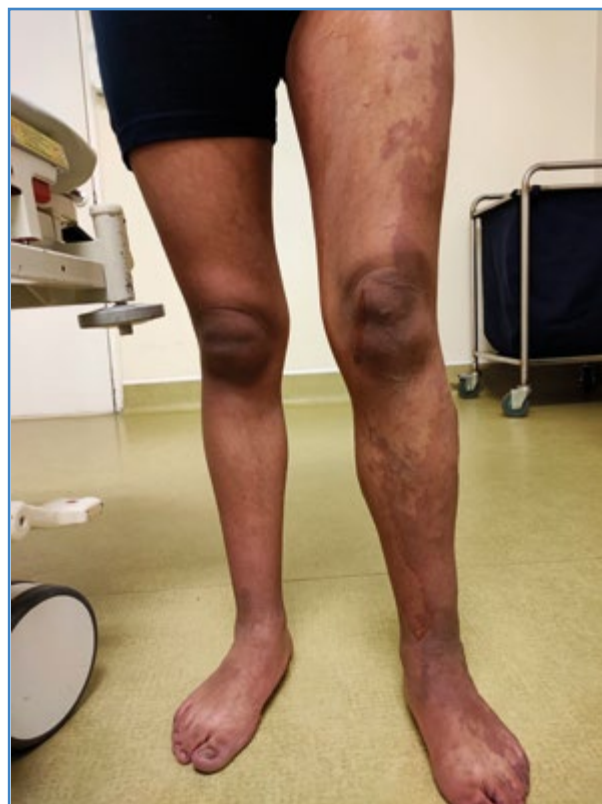
Figura 1. Mancha en vino de Oporto, edema e hipertrofia en miembro izquierdo.

En la exploración física se evidenciaron lesiones cutáneas maculares, confluentes, en vino de Oporto, con bordes geográficos no definidos, irregulares, no sobreelevados y que se extendían desde la cadera izquierda hasta el dorso del pie ipsilateral, edema y venas varicosas CEAP 4, predominantemente en la cara externa del muslo y en la pierna izquierdas, pulsos