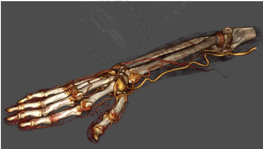
Figura 1. Angiografía por tomografía computarizada que muestra aneurisma de arteria radial de 22 mm y permeabilidad de los arcos palmares superficial y profundo.

Mujer de 75 años, costurera jubilada, antecedentes de tabaquismo, hipertensión arterial, artrosis y prótesis de rodilla izquierda. Refiere masa pulsátil dolorosa y atraumática en tabaquera anatómica derecha desde hacía 5 años. Se diagnostica, mediante ecografía-Doppler y tomografía computarizada, aneurisma radial de 18 mm, apreciándose permeabilidad de los arcos palmares superficial y profundo (Fig. 1). Por riesgo de embolización distal, se resecó el aneurisma (Fig. 2). No se reconstruyó la arteria radial dada la normalidad del test de Allen en la exploración física, la permeabilidad de los arcos palmares en prueba de imagen y el buen reflujo radial en la cirugía.